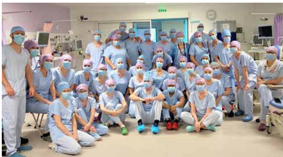
Le personnel de l'ICM fait preuve d'un engagement sans faille pour la sécurité des patients.

Au-delà du port obligatoire de masque pour toute circulation dans l'établissement et dans les espaces partagés, l'interdiction de tout regroupement, le respect des distances sociales, et le lavage systématique des mains, nous avons déployé aux différents accueils physiques postés (accueil, admissions, secrétariats avec accueil fréquent) de barrières de protection en polycarbonate. ■