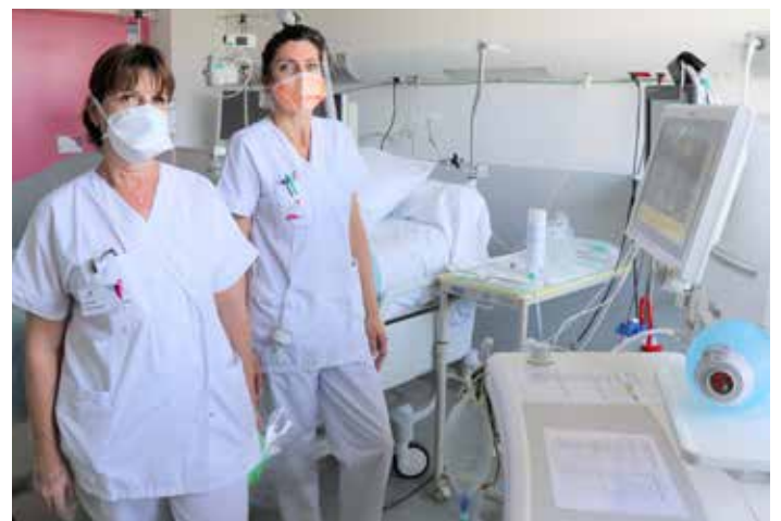
Mise en place de lits de réanimation avec aspirateurs.

Tout le long de la crise, l'ICM a apporté une attention particulière au suivi de certains stocks de matériels essentiels à l'activité (masques FFP2 et chirurgicaux, blouses, lunettes) pour faire face aux besoins de protection des patients et du personnel. ■